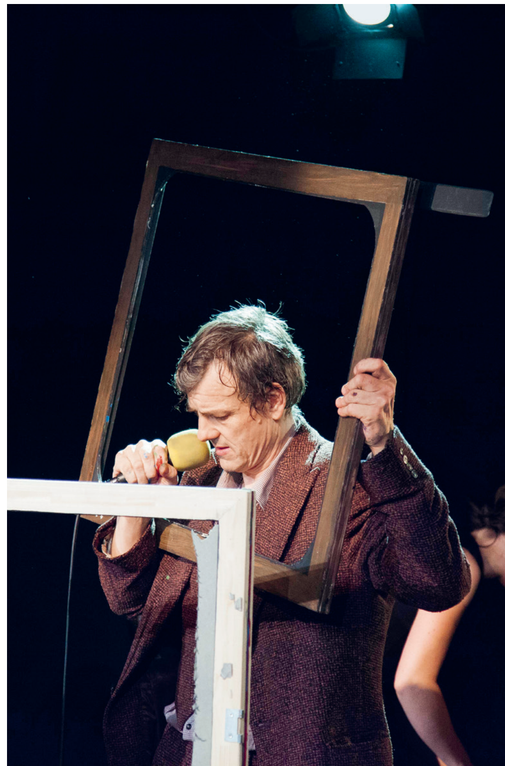
«Letzter Aufruf für Ursin und Kubus» – Ruedi Häusermann – 8. und 9. März im ThiK Theater im Kornhaus