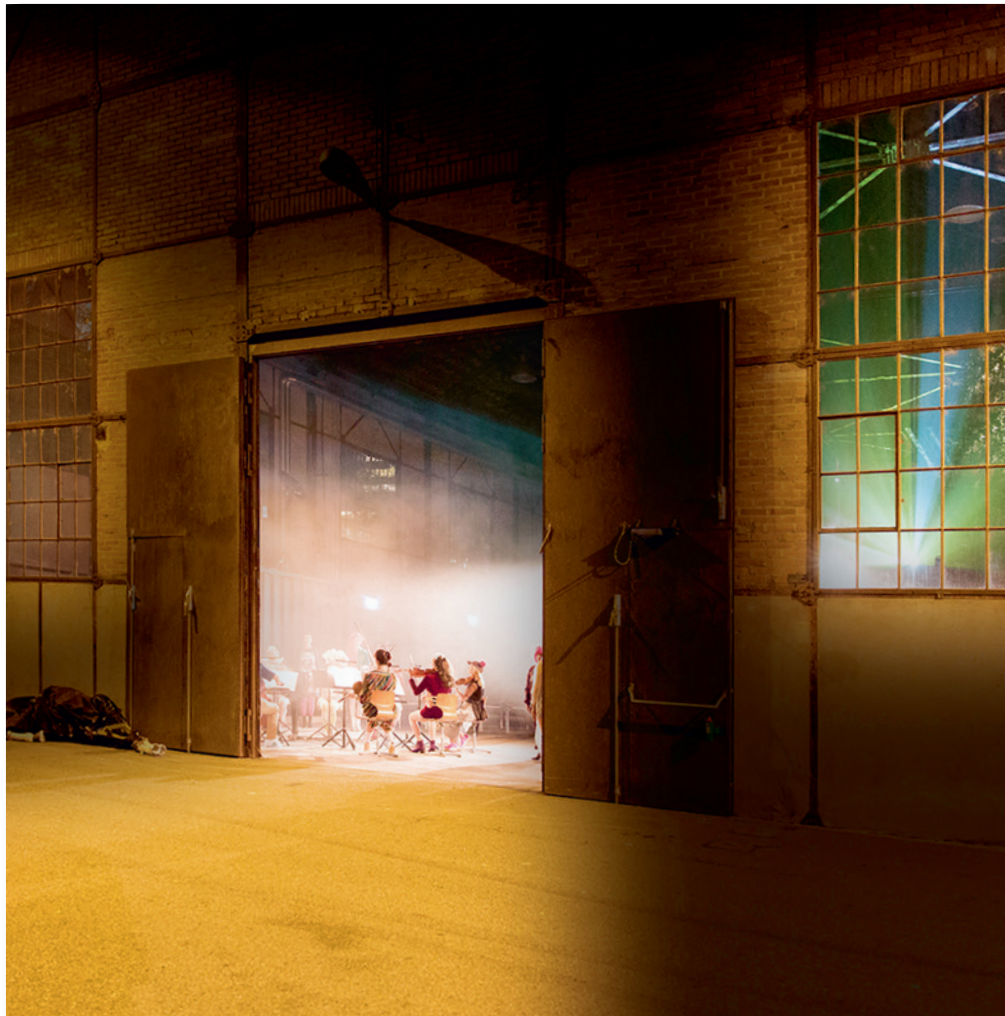
Eines der «Ausser Haus» Highlights 2018/19: «Eroica» – argovia philharmonic & Theater Marie – am 13. und 14. September 2018 in der Alten Schmiede Baden