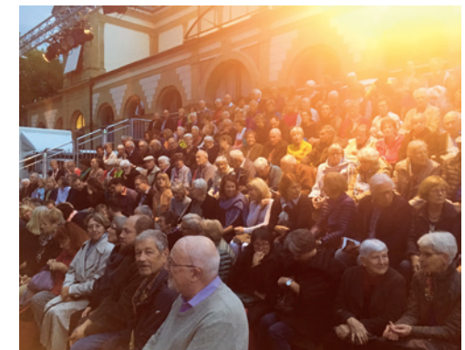
In der Pause beginnt es zu regnen, aber das schreckt unser Publikum nicht. Dank mitgebrachter Regenpelerinen harren alle aus und nach 15 Minuten ist es schon wieder trocken.