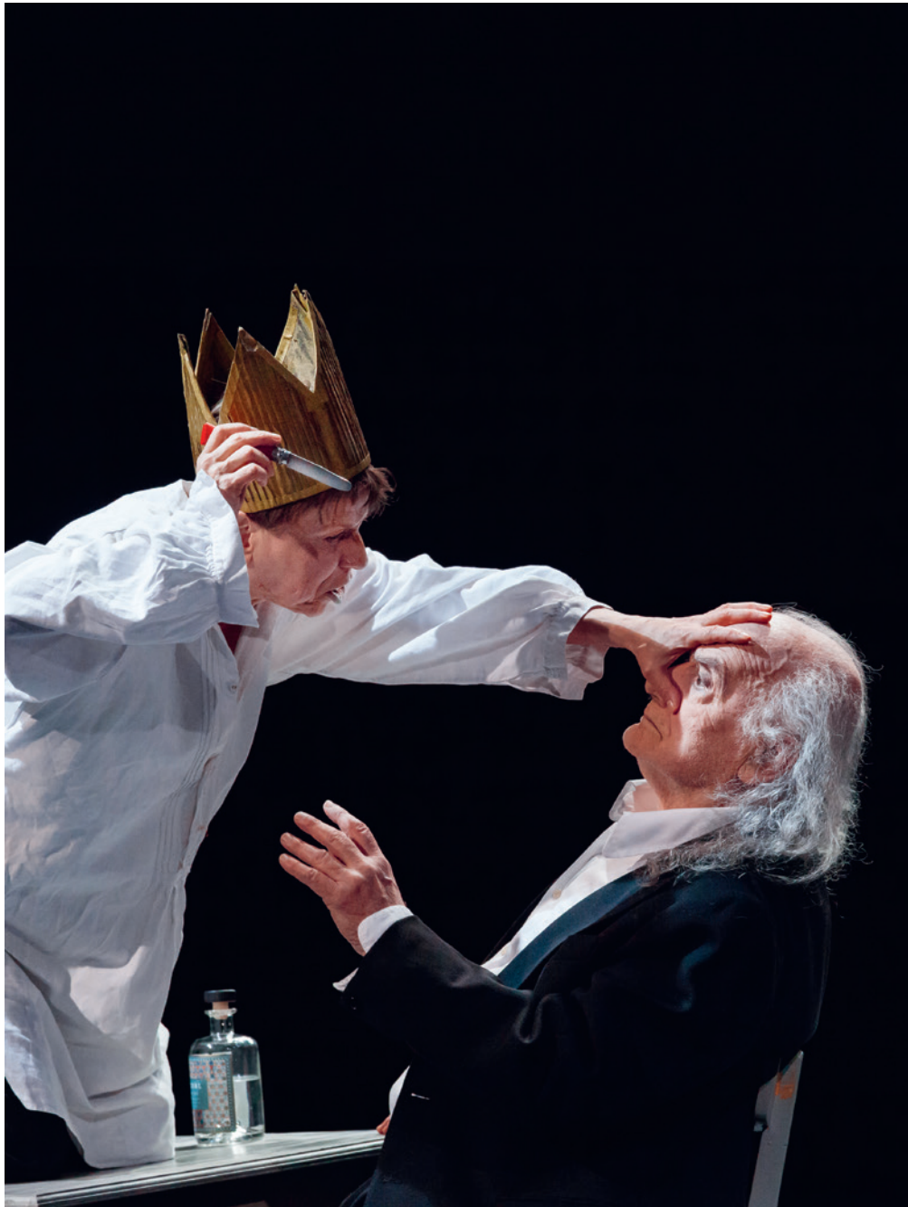
«Peer Gynt» – Theater an der Ruhr – 29. November 2018 im Reformierten Kirchgemeindehaus Baden

3'953 Zuschauer*innen 24 Stücke 13 Spielorte 53 kuratierte Vorstellungen 10 sonstige Veranstaltungen (wie z. B. Stückeinführungen) + 16 Aufbau- und Probenstage