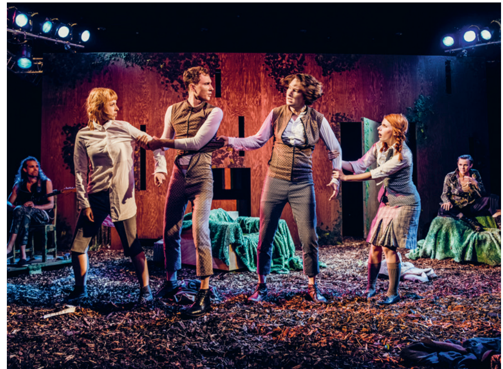
Impressionen vom «Sommernachtstraum» im Kurpark (6. September 2019)